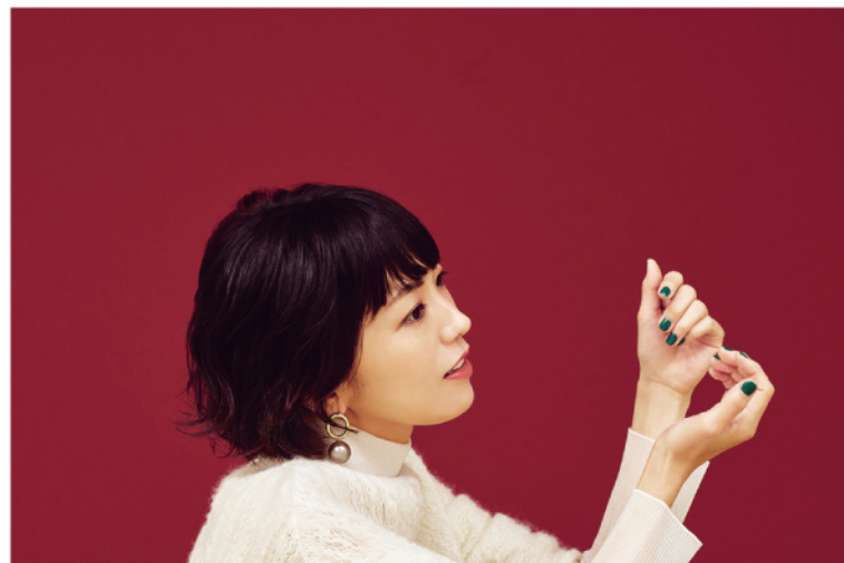
熊木杏里(くまき・あんり)

シンガーソングライター。小学校まで千曲市で暮らす。「杏里」の名前は、あんずの里に生まれたことを祝福する祖父からもらった。「Hello Goodbye & Hello」は、新海誠監督のアニメ映画『星を追う子ども』の主題歌。テレビドラマ「3年B組金八先生」では、楽曲「私をたどる物語」が劇中挿入歌に。活動20周年の2022年11月には、13枚目のアルバム「風色のしおり」をリリース