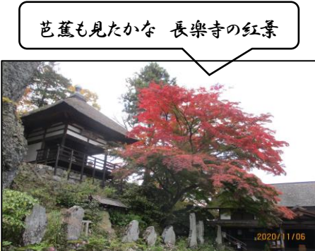
芭蕉も見たかな 長樂寺の紅葉