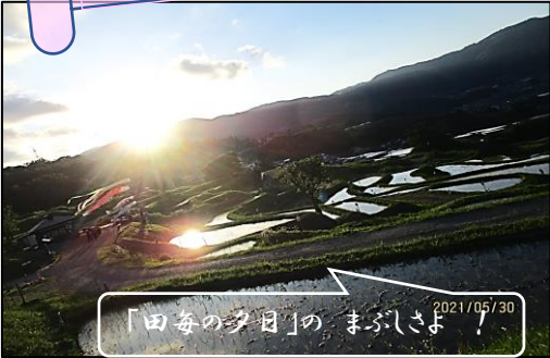
「田毎の夕日」の まぶしさ! 2021/05/30

あなたのステキな「さらしな」「千曲市」その一瞬をパチリ! そして特別な「ひと言」をそえてね!