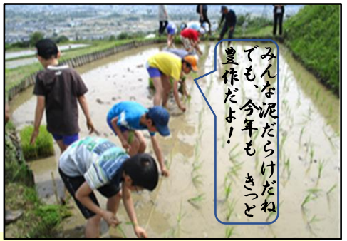
みんな泥だらけだね でも、今年もきつと豊作だよ!