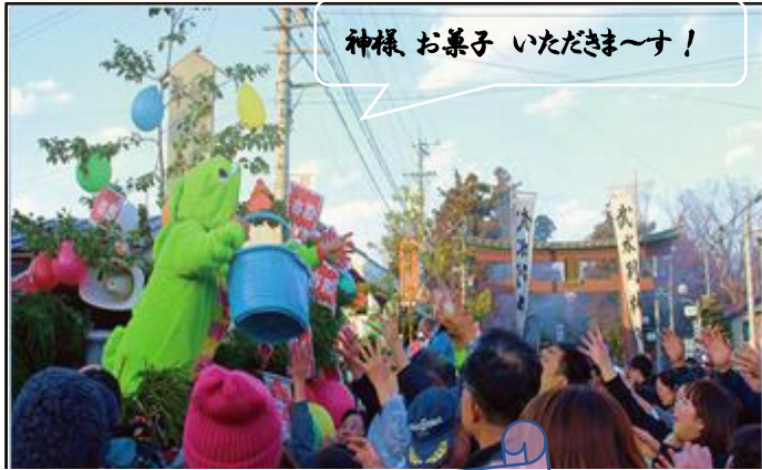
神様 お菓子 いただきま〜す!