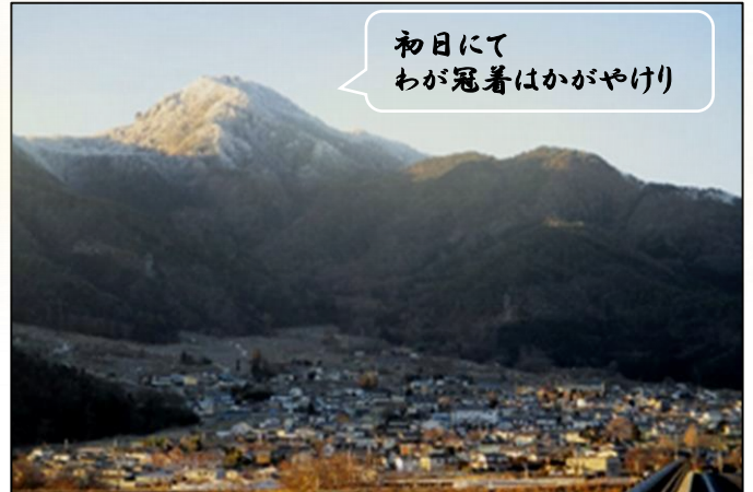
初日にて わが冠着はかがやけり

昨年六月、千曲市は、「月の都」として、日本遺産に選定されました。 千曲市西部に位置する「さらしなの里」は、平安時代から皆があこがれる「月の都」として有名だったのです。